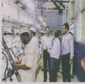
The project kick-started in February and has engaged around 30 inmates as of now, more are to follow

The project kick-started in February, after Minda SAI Ltd set up a manufacturing assembly and a production unit for the inmates. The company has engaged around 30 inmates as of now